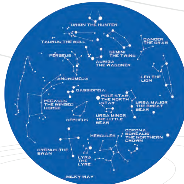
NORTHERN SKY / NORRA HIMLEN / NORDHIMMEL DEN NORDLIGE STJERNEHIMMEL / POHJOINEN TAIIVAS

Kaukoptukken avulla voit nähdä tuttuja tähdistöjä sekä löytää aivan uusia tähtikuiviot. Kuinka monta tähtikartan tähdistöä löydät. Tutki taivasta ja katso kuinka monta planeettaa löydät.