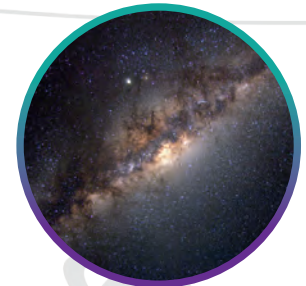
MILKY WAY VINTERGATAN MELKEVEIEN MELKEVEJEN LINNUNRATA

WARNING! Not suitable for children under 36 months. Choking hazard, small parts. Wipe clean only. Please retain this information for future reference. VARNING: Ej lämplig för barn under 3 år. Innehåller små delar. Kvävningssrisk. Torka rent. Spara instruktionerna för senare användning. ADVARSEL! Ikke egnet for barn under 3 år. Inneholder små deler. Fare for kvælning. Tørk av for å rengjøre. Ta vare på denne informasjonen for framtidig referanse. ADVARSEL! Uegnet til barn under 3 år. Inneholder små dele. Risiko for kvælning. Tør kun af. Gem denne information til fremtidig kontakt. VAROITUS! Ei sovelle alle 3-vuotiaalle. Sisältää pieniä osia. Tukehtumisvaara. Puhdistus kuivalla liinalla. Säilytä nämä tiedot.