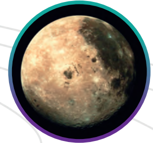
MOON MÄNEN KUU