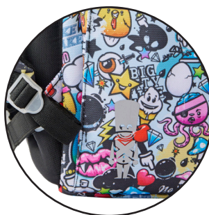
Reflekser på alle sider