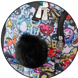
Aftagelige Boost-my-bag figurer