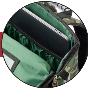
Lomme til PC