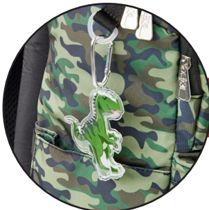
Aftagelige Boost-my-bag figurer