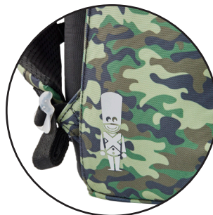
Reflekser på alle sider