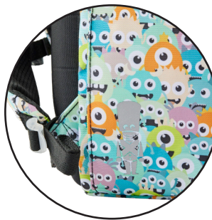
Reflekser på alle sider