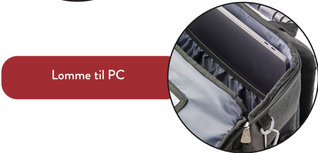
Lomme til PC