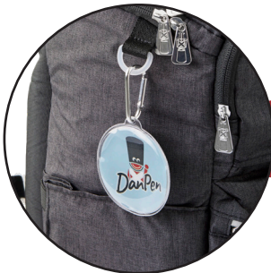
Aftagelige Boost-my-bag figurer