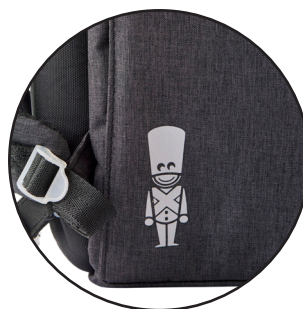
Reflekser på alle sider