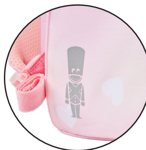
Reflekser på alle sider