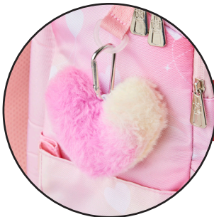
Aftagelige Boost-my-bag figurer