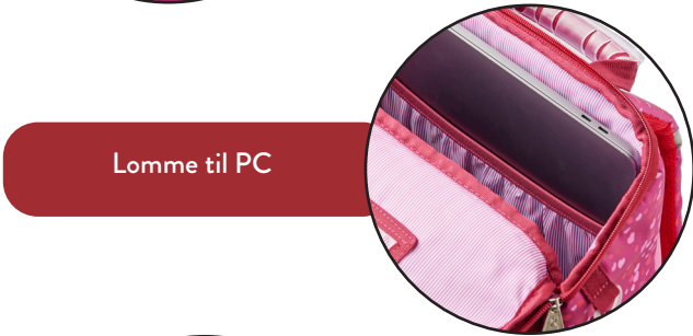
Lomme til PC