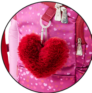
Aftagelige Boost-my-bag figurer