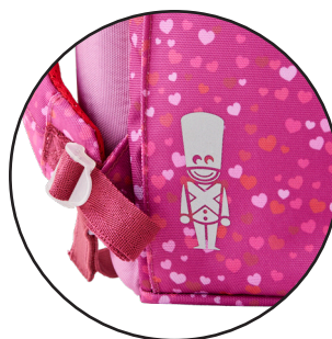
Reflekser på alle sider