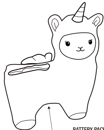
BATTERY PACK LOCATION